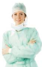
INDUMENTARIA UN SOLO USO