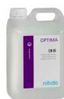
OPTIMA CM 05