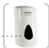
FOAM HN DISPENSER Dosificador de jabón en espuma