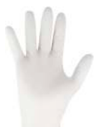
GUANTES LÁTEX, VINILO, NITRILO