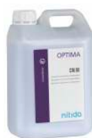
OPTIMA CM 80

Detergente atomizado encimático concentrado