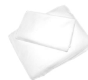
TOALLAS Y SÁBANAS DESECHABLES