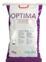
OPTIMA SL 40

Detergente atomizado encimático concentrado