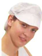
GORRAS POLIPROPILENO CON VISERA