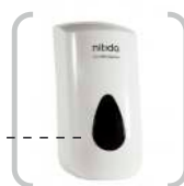
FOAM HN DISPENSER Dosificador de jabón en espuma