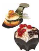
CUCHARAS Y MINI VASOS DEGUSTACIÓN