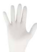
GUANTES LÁTEX, VINILO, NITRILO