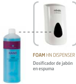
FOAM HN DISPENSER Dosificador de jabón en espuma

Detergente sólido y abrillantadores ultraconcentrados