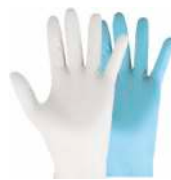
GUANTES LÁTEX, VINILO, NITRILLO