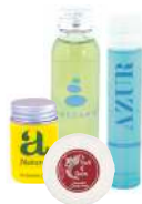
PRODUCTOS DE ACOGIDA (AMENITIES)