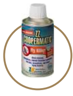
INSECTICIDA PERITRINAS NATURALES