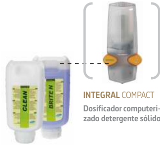
INTEGRAL COMPACT Dosificador computerizado detergente sólido