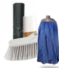
SACOS Y BOLS. DE BASURA / ÚTILES DE LIMPIEZA

Servicios integrales de optimización y ahorro